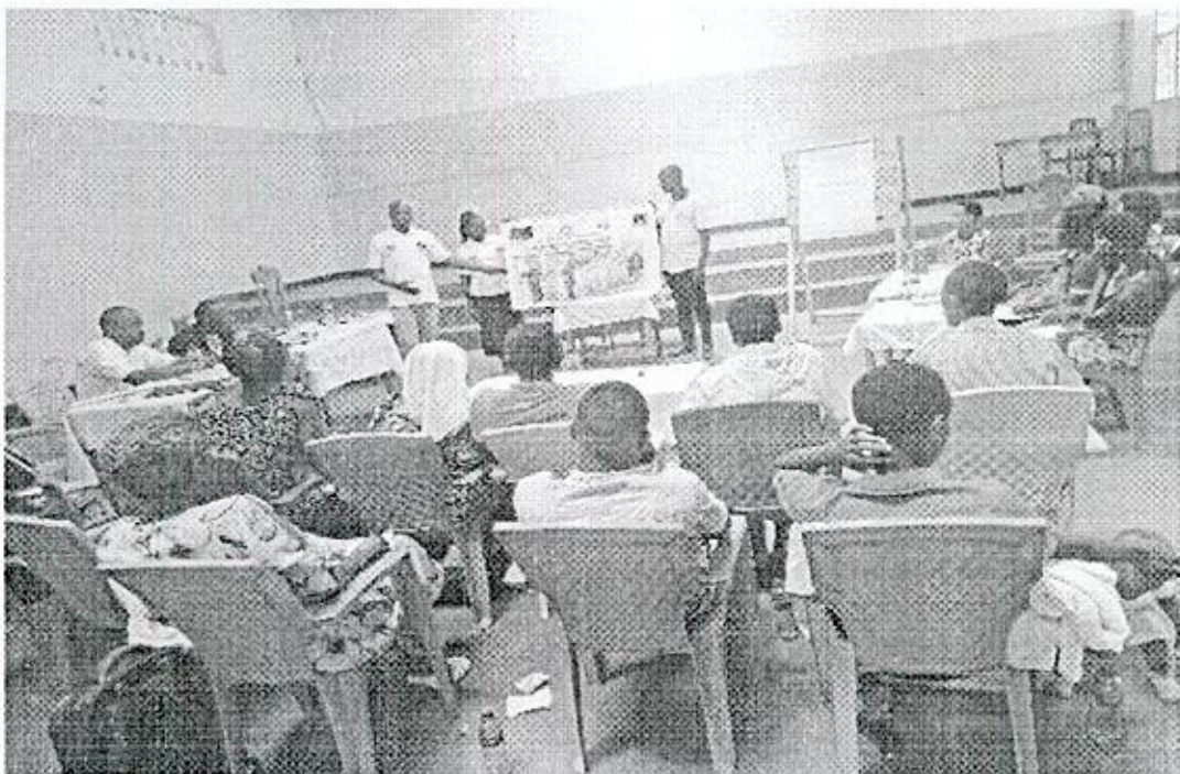
PHOTO : TENUE DE L'ANIMATION D'UN DIALOGUE INTERGÉNÉRATIONNEL

Ce rapport relate les activités comptant pour l'année 2023 dans le cadre du projet intitulé « Projet de Renforcement de la Société Civile Burundaise contre les violences basées sur le genre » PRESCIBU-TUYATUZE.