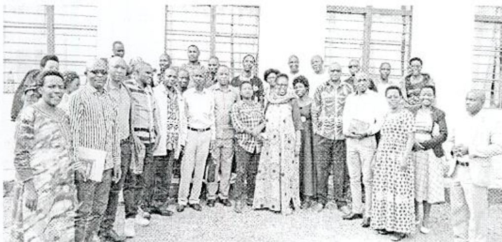
PHOTO : ATELIER D'ÉCHANGE D'EXPÉRIENCES ENTRE LES DCE ET ICE DE MUYINGA SUR LES APPROCHES DU PROJET EDUFAM

De Janvier à décembre 2023, plusieurs activités ont été réalisées dans la zone cible en vue d'atteindre l'objectif du projet. Le présent rapport se rapporte sur les activités de ces deux volets du projet EDUFAM à savoir Egalité Femme Homme et EDUCATION.