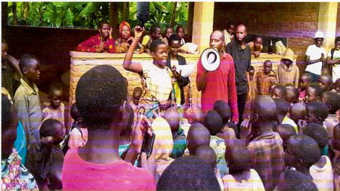
À RUTÉGAMA

Au cours de l'année 2023, le CAFOB a poursuivi la mise en œuvre du programme DGD22-26 intitulé « Favoriser la réduction durable de la prévalence des VBG par la transformation des normes discriminatoires à l'égard des femmes au Burundi »